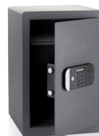
Mecanismo de cierre motorizado, dos bulones de cierre anti-sierra (22mm), placa antitaladro y puerta cortada a láser