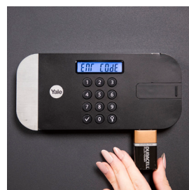
Batería de respaldo externa de 9V para cuando las pilas se agoten