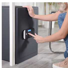
Código PIN de acceso con pantalla de teclado LCD